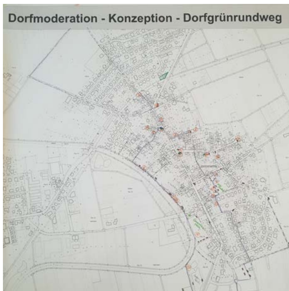
Dorfgrundweg Stand 21.10.2021